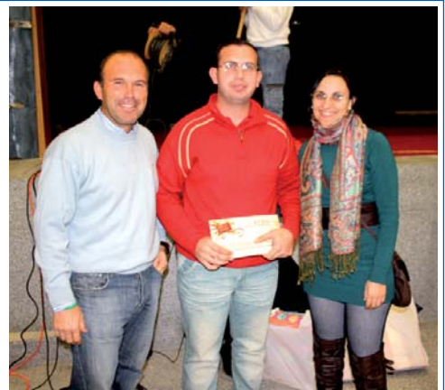
XIII CICLO NAVIDEÑO

■ La cabalgata de Reyes Magos fue una de las actividades del ciclo navideño. Otra de las novedades del ciclo de este año fue la actuación teatral de los alumnos de la Escuela de Música. En ese acto se dieron los premios a los concursos organizados con motivo de la navidad.