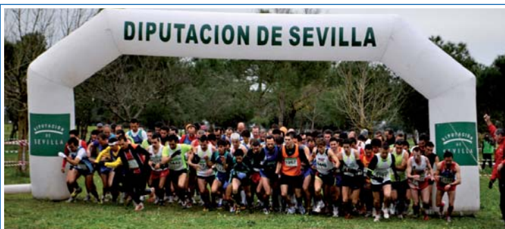
FINAL PROVINCIAL CAMPO A TRAVÉS

■ Deporte y Villamanrique como sinónimos. Esta vez a través de un evento de importancia provincial. La final de campo a través de la Provincia de Sevilla tuvo lugar el pasado 23 de enero en la Zona Verde. Más de 700 atletas disfrutaron de un entorno incomparable.