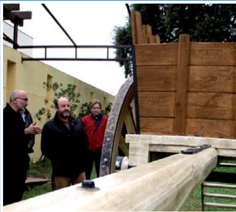
EXPOSICIÓN TALLER EMPLEO

■ Llegado a su fin el prolífico taller de empleo, los alumnos mostraron en las dependencias del Centro de Visitantes los trabajos realizados a lo largo de un año de taller.