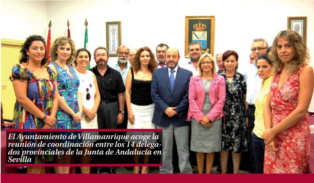
El Ayuntamiento de Villamanrique acoge la reunión de coordinación entre los 14 delegados provinciales de la Junta de Andalucía en Sevilla